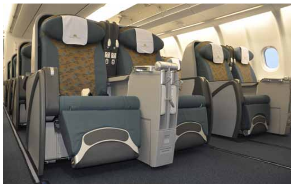
● Nhập khẩu ghế máy bay

Để đạt được những thành công đó, ngoài những điều kiện thuận lợi sẵn có như: truyền thống đoàn kết, tinh thần trách nhiệm cùng với sự mẫn cán, tận tụy, sáng tạo và bề dày kinh nghiệm của đội ngũ cán bộ, người lao động thì Ban lãnh đạo AIRIMEX đã chủ động, kịp thời đề ra và thực hiện kiên quyết, có hiệu quả một số giải pháp phù hợp, đó là: