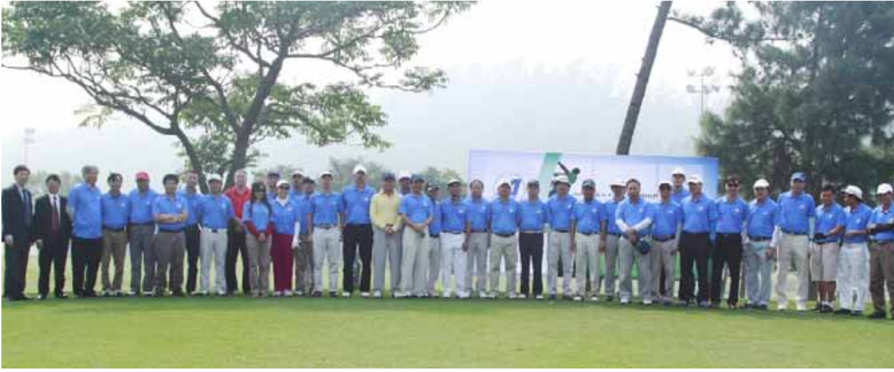
● Giải thể thao tri ân khách hàng